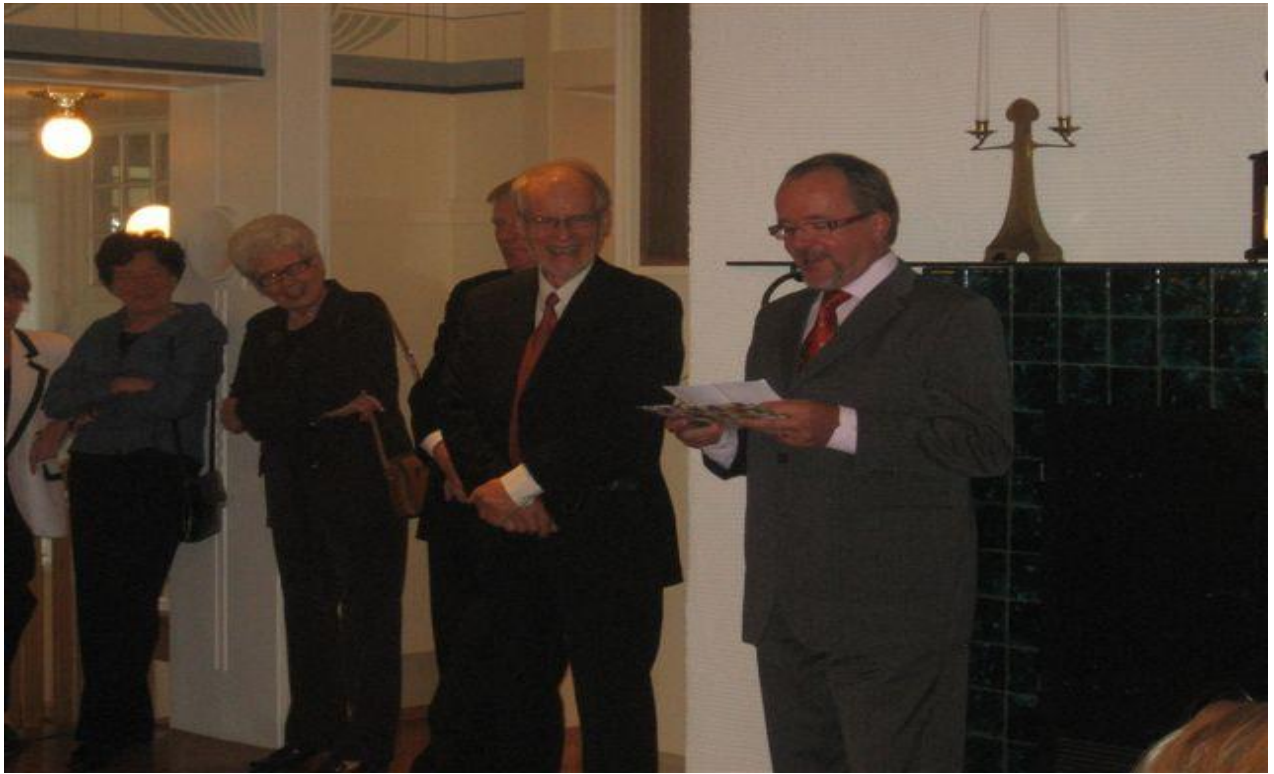
Joululounas 2015 Niittykummussa