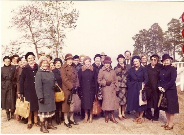
Eläkejaoston "kevättapaaminen" 4.83 Reposaari